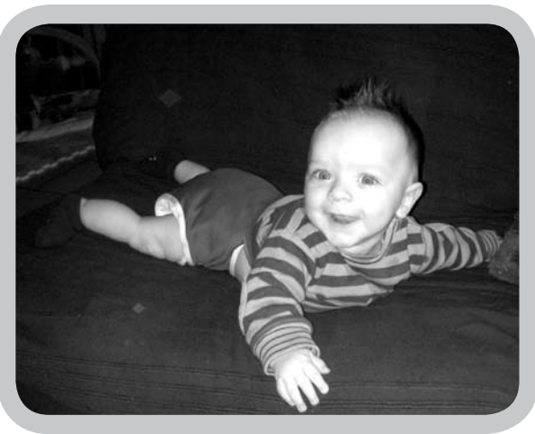
Uiteindelijk valt het extra werk met het wassen van de luiertjes wel mee...

Er waren eens een toekomstige mama en papa, beiden overtuigd dat ze ook hun steentje wilden bijdragen tot een beter milieu. Daarom besloten ze om hun toekomstige spruit "in de doeken" te leggen. Rondom hen bleken er heel wat vooroordelen omtrent het gebruik van wasbare luiers. Reacties als "amai, 't is zoals in den ouden tijd" of "je doet jezelf wat aan, maak het je toch makkelijk; wegwerpluiers zijn met reden uitgevonden", toch lieten ze zich niet doen. Ze zochten veel informatie en legden hun oor te luisteren bij o.a. een luierinfoavond en een vriendin die zelf heel wat ervaring had met een groot gamma luiers.