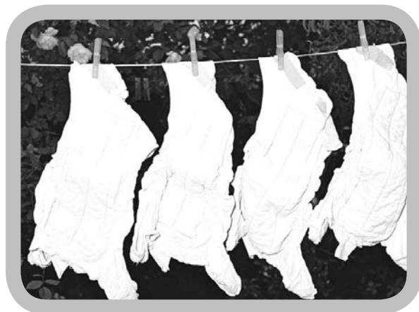
Luiers drogen aan de waslijn is milieuvriendelijker.

Als je toch een droogkast gebruikt, centrifugeer dan vooraf goed het wasgoed bij een zo hoog mogelijk toerental. Centrifugereren zelf kost minder energie en bespaart aanzienlijk op het energieverbruik van de droger.