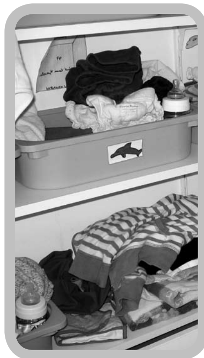
Vouw luier, inlegger en inlegvliesje samen, klaar voor gebruik, en leg ze samen met de overbroekjes bij de kleertjes.

Ook in de opvang staat men niet altijd te springen om wasbare luiers te gebruiken. Veel gehoorde tegenargumenten zijn: plaats-