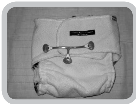
luier met luierklem

All-in-one luiers zijn erg handig voor in de opvang, voor bij de grootouders, of voor op stap.