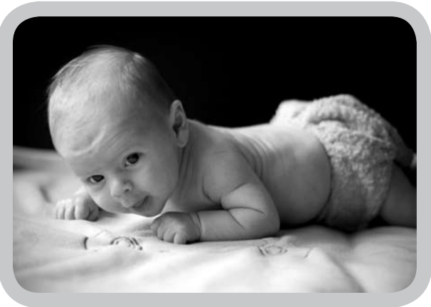
Na anderhalf jaar is de begininvestering terugverdiend.

Het ideale mag tot de verbeelding spreken, geen enkele luier is ideaal. Zowel de wegwerpluier als de wasbare luier, elk heeft een aantal plus- en minpunten voor het milieu, het gebruik, het gemak ... en vooral voor de babybiljetjes.