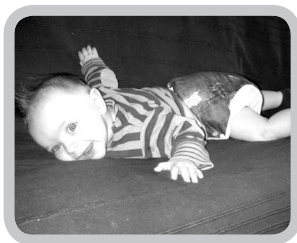
Wanneer een uitstap gepland is, gebruiken we beter absorberende luiers.