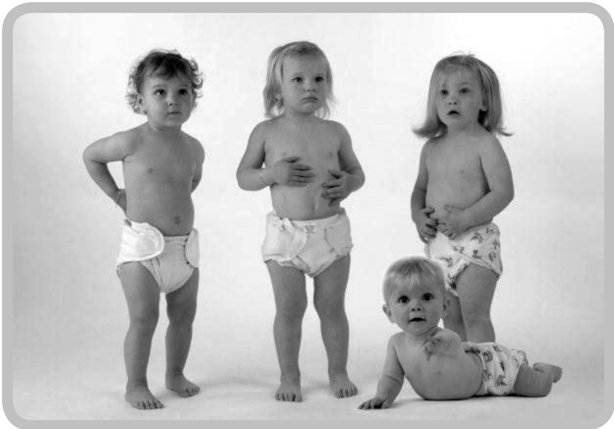
Tegenwoordig bestaan wasbare luiers in verschillende materialen