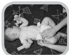
hoeveel extra werk?