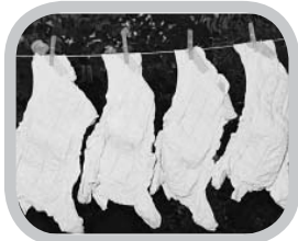
hoe zien ze eruit?