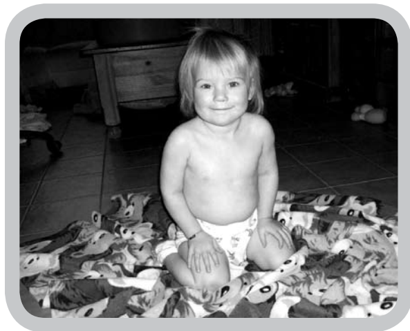
Binnen de week waren de billetjes zo goed als genezen!

Als mama van 3 kindjes en onthaalmoeder van 7 kindjes vertel ik graag hoe wij met wasbare luiers begonnen zijn.