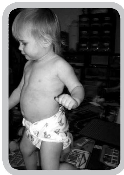
De ouders van mijn opvangkindjes zijn erg tevreden met de keuze voor wasbare luiers, het bespaart hen een hoop tijd en geld.