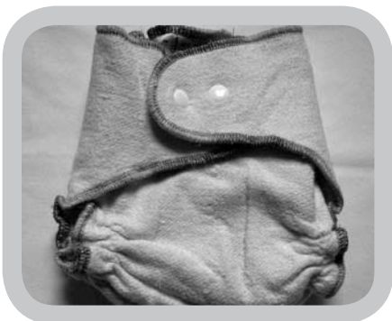
luier in hennep

De teelt van bamboe is milieuvriendelijk, omdat bamboe snel groeit, zonder pesticiden geteeld wordt, weinig water nodig heeft en CO 2 absorbeert. Maar om van bamboe viscose te kunnen maken (=de stof die men gebruikt om er luiers van te maken), zijn chemische solventen nodig. In luiers zonder label kunnen nog resten van deze solventen aanwezig zijn.