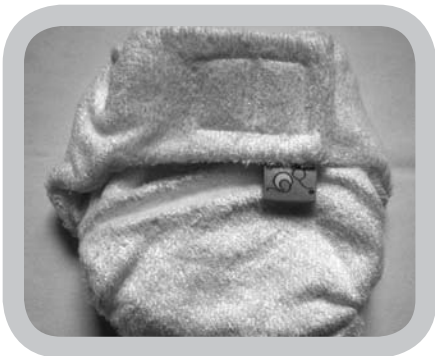
luier in bamboe