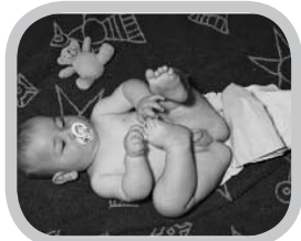
welke systemen bestaan er?