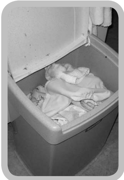
Je kunt de luiers droog bewaren of in water.

gebrek voor een luiерemmer, de nood aan een extra verschooning bij sommige soorten luiers, het idee dat deze luiers vaker zouden lekken, of vaker huidirritaties zouden veroorzaken, en geurhinder met zich mee zouden brengen.